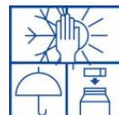
Vorstvrij, koel en droog opslaan. Verpakking goed sluiten