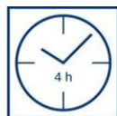
Droogtijd overschilder- baar na 4 uur